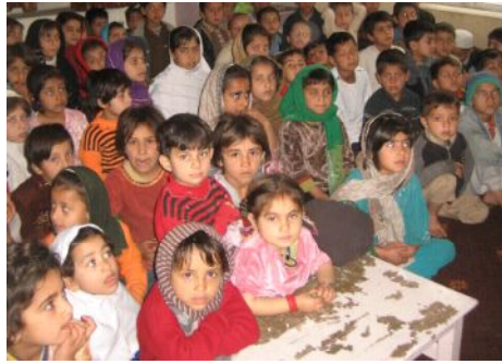
図書館の特別教室に来る子どもたち