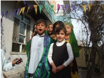
誕生日会で歌を発表する子どもたち

宗教上の理由により絵本や本に偏見や拒否反応を示す人々への図書館活動の理解を深めてもらうため、地域関係者や親を招いた会合も開いています。