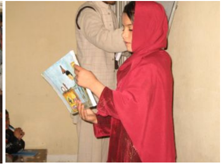
自ら読み聞かせを行う女の子