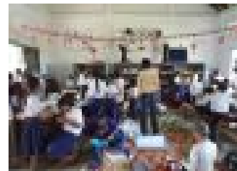
研修会後の図書室