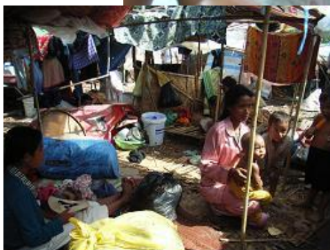
スラムに住む家族