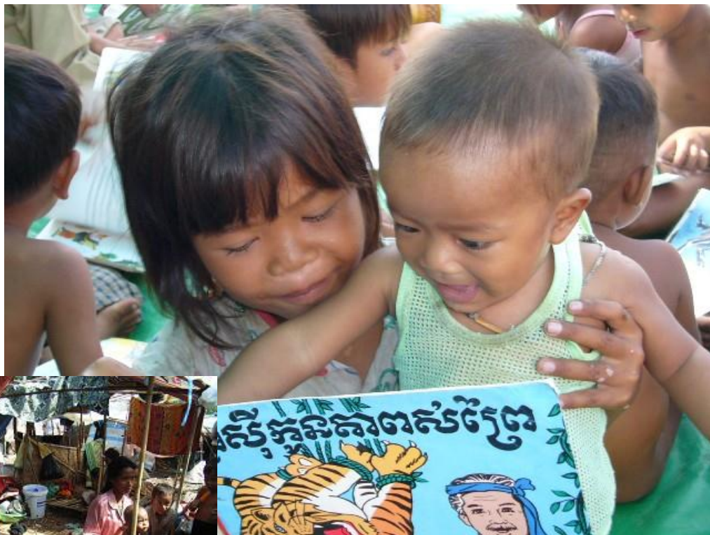
学校に行けない子ども達に文字に触れる機会を！