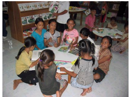
併設された図書室で絵本をよむこともできます

今は踊りだけでなくクラナート(木琴)と料理のクラスに参加しています。図書室で本を読むのも楽しみです。