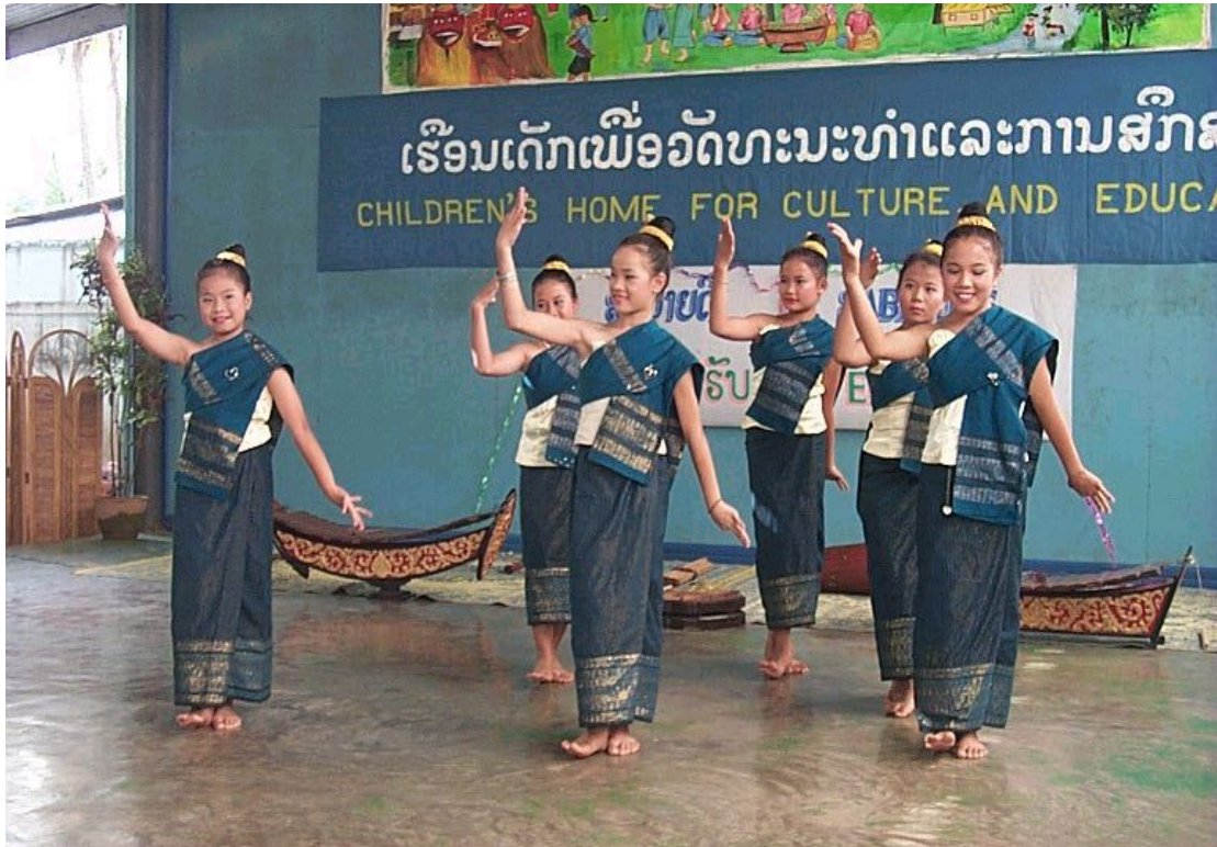
ラオスの伝統舞踊をおどるこどもたち

「ラオスは周りを大国に囲まれた経済的に貧しく小さな国です。しかし古くから伝わる美しい伝統と文化があります。未来を担う子どもたちにはラオス人としての誇りと文化をしっかりと受け継いでほしいのです」(子どもの家スパン所長)