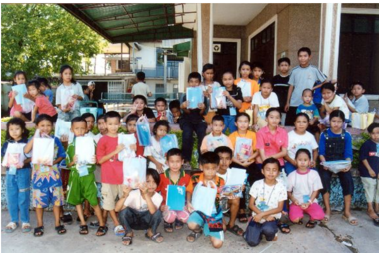
子どもの家で行われた行事に参加した子どもたち

現在は週平均500人～600人の子どもたちが通ってきています。特に学校がない土曜日・日曜日に通ってくる子どもたちが多く、活発に活動が行われています。