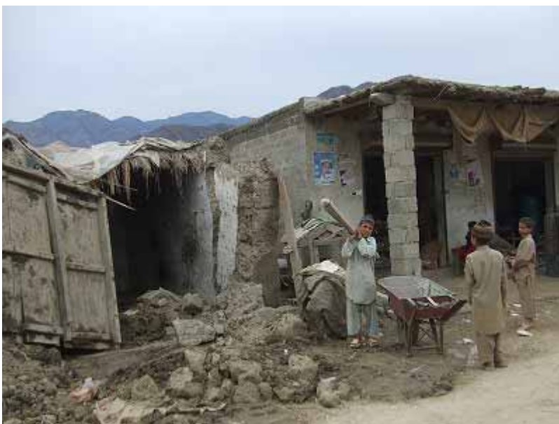
被害にあった市場

橋は破壊され道が閉ざされていたため、警察はヘリコプターを使い、洪水の被災者の救援にあたった。