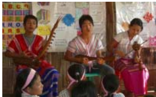
3種類の楽器の演奏