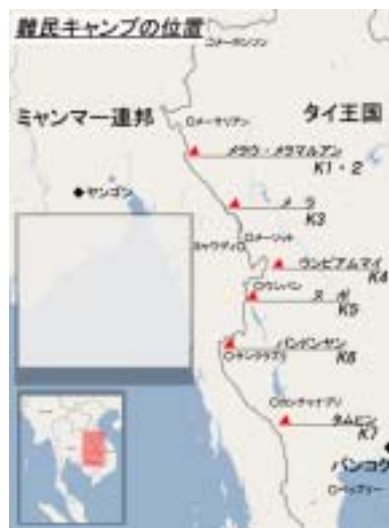
図 1 メラキャンプの位置

今回の調査を行ったメラキャンプは、ターク県メーラマ郡に位置する。メーソットからは 60km、車で 1 時間ほどである。舗装された一本道をメーソットから走っていくと、山の中に急に不自然に現れるのがこのキャンプである。道路沿いに約 4km に渡って続くこの大きなキャンプは、周りはビルマとの国境である山に囲まれ、敷地面積は約 2 平方km に及ぶ。とても 1 日で回れる広さではない。キャンプは鉄条網の柵で道路と隔てられているが、ところどころに穴が開いているので、道路に出ることは容易である。しかし、キャンプの両端には検問所があり、警察官が警備にあたっているため、出るといっても、自由にキャンプの外に出られるわけではない。