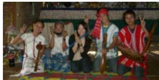
伝統文化教室の先生