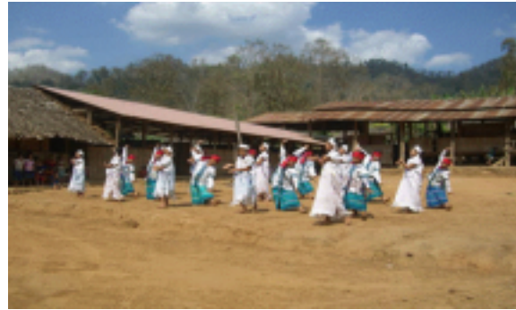
カレン民族の伝統舞踊と演奏