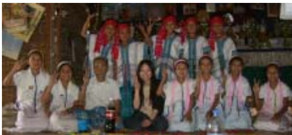
伝統文化教室の生徒